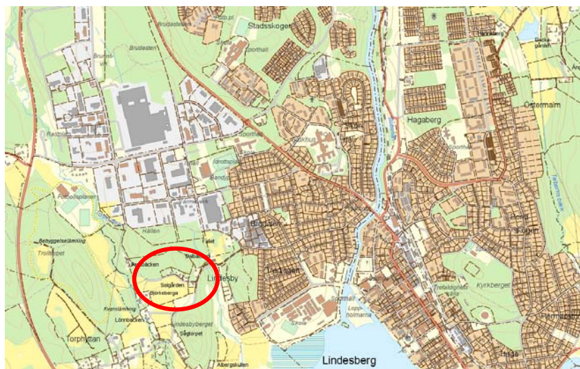
Planområdets placering röd cirkel i förhållande till Lindsberg

Planområdet ligger i den sydvästra utkanten av Lindsberg.